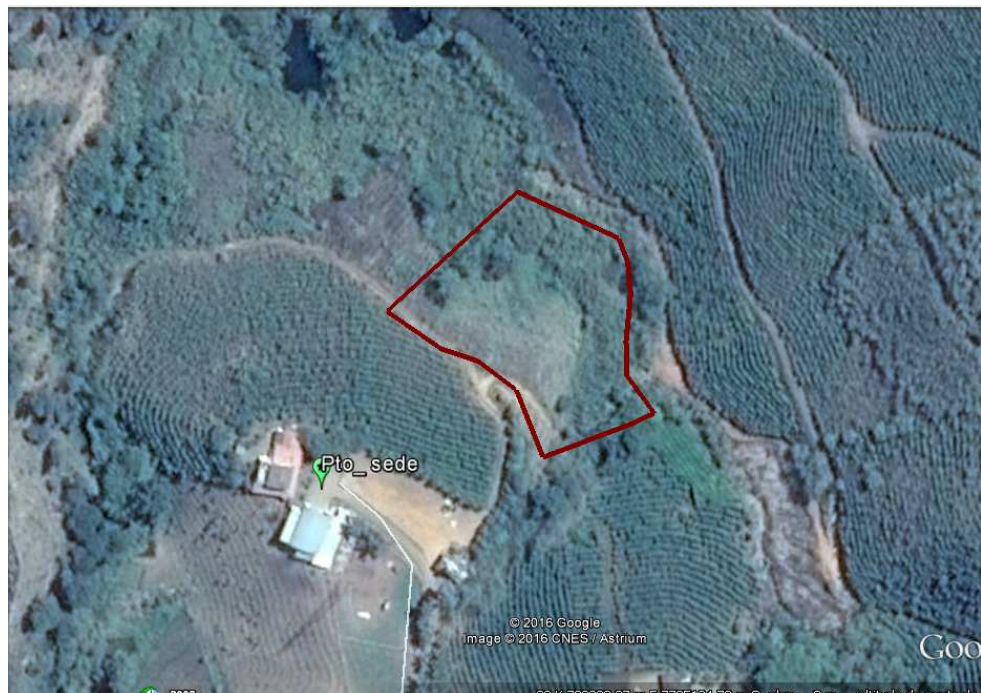
Figura 02- Fonte: Imagem de localização do Google Earth.