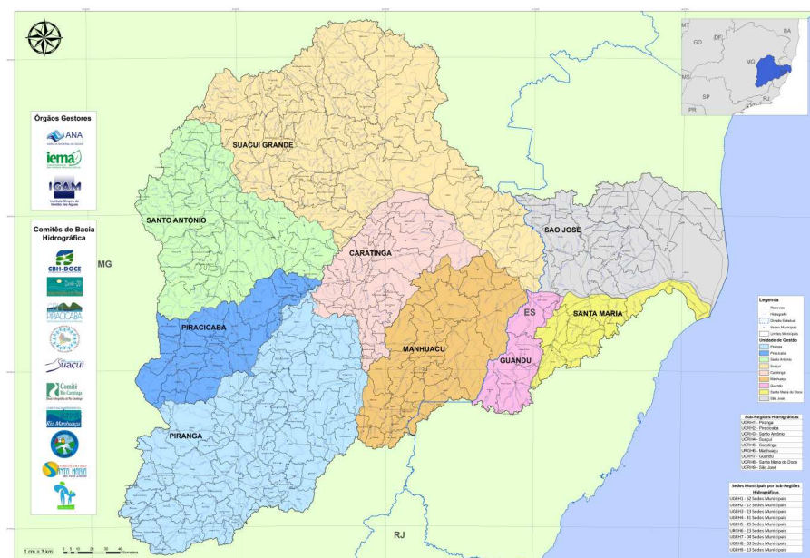
Figura 1 Localização da bacia do rio Doce

As nove unidades estaduais de gestão de recursos hídricos (UGRHs) da bacia contemplam as UGHR1 Piranga; UGHR 2 Piracicaba; UGHR 3 Santo Antônio; UGHR 4 Suaçuí; UGHR 5 Caratinga e UGHR 6 Manhuaçu, em Minas Gerais, e três no Espírito Santo, correspondente às UGHR 7 Guandu; UGHR 8 Santa Maria do Doce e UGHR 9 São José.