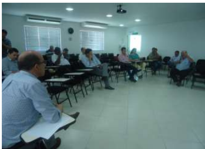
Diretoria Colegiada – 01/09/2015