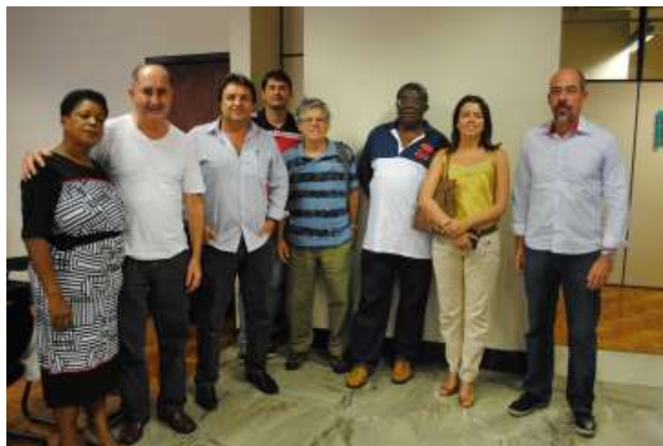
25 e 26 de fevereiro de 2015 – Belo Horizonte/MG