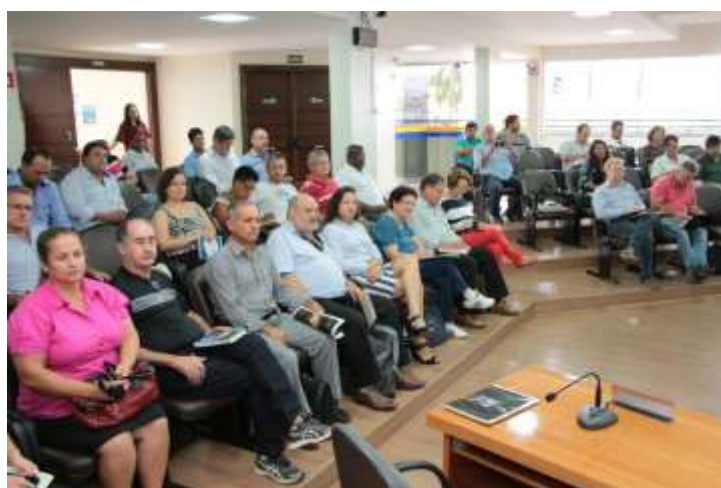
17 e 18 de junho de 2015 – Unaí/MG