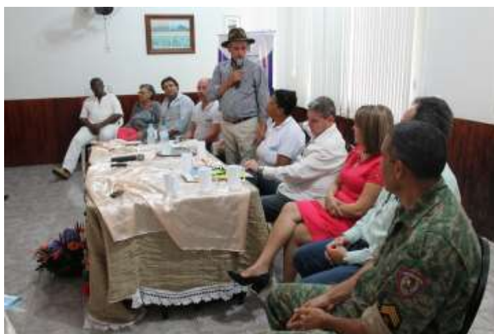
26 e 27 de agosto de 2015 – Alto Caparaó/MG