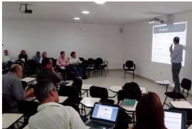
Diretoria Colegiada – 24/06/2015

ANEXO XXII – Fotos - Reuniões da Diretoria Colegiada do CBH-Doce e da Câmara Técnica de Integração (CTI) do CBH-Doce