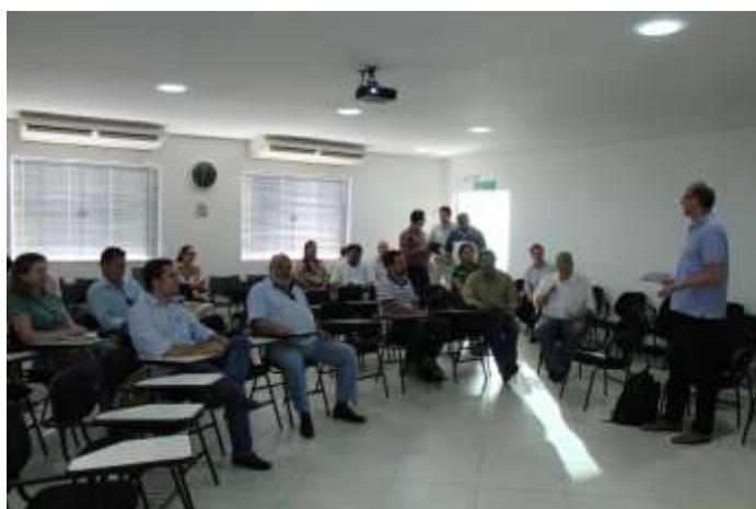
Diretoria Colegiada – 30/11/2015