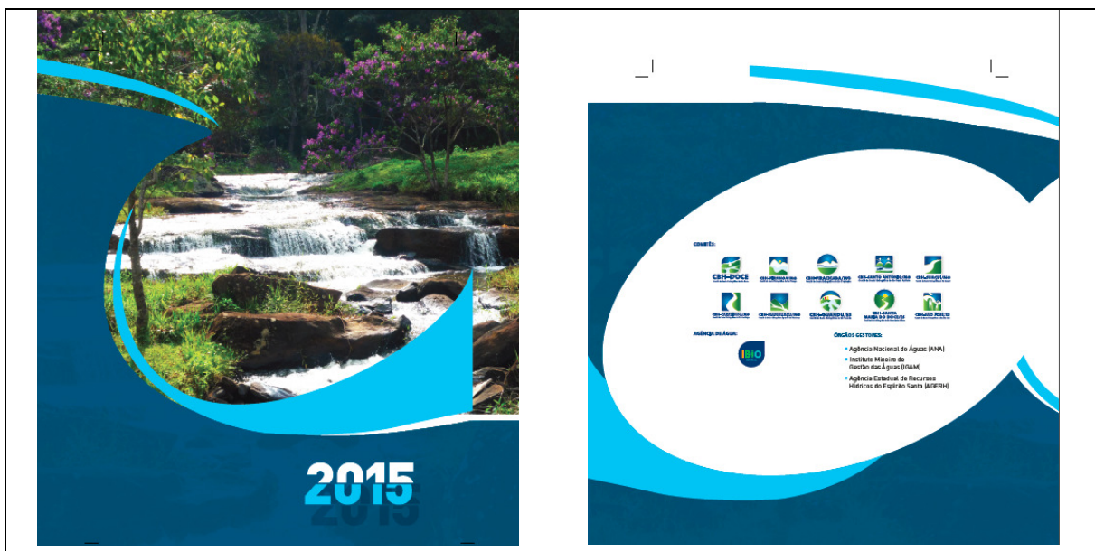
Frente e verso da Agenda 2015

A empresa elaborou a arte da agenda diária para os comitês e o IBIO – AGB Doce para o ano de 2015. A agenda é unificada para os comitês e traz, a cada mês, a carta compromisso elaborada pelos comitês.