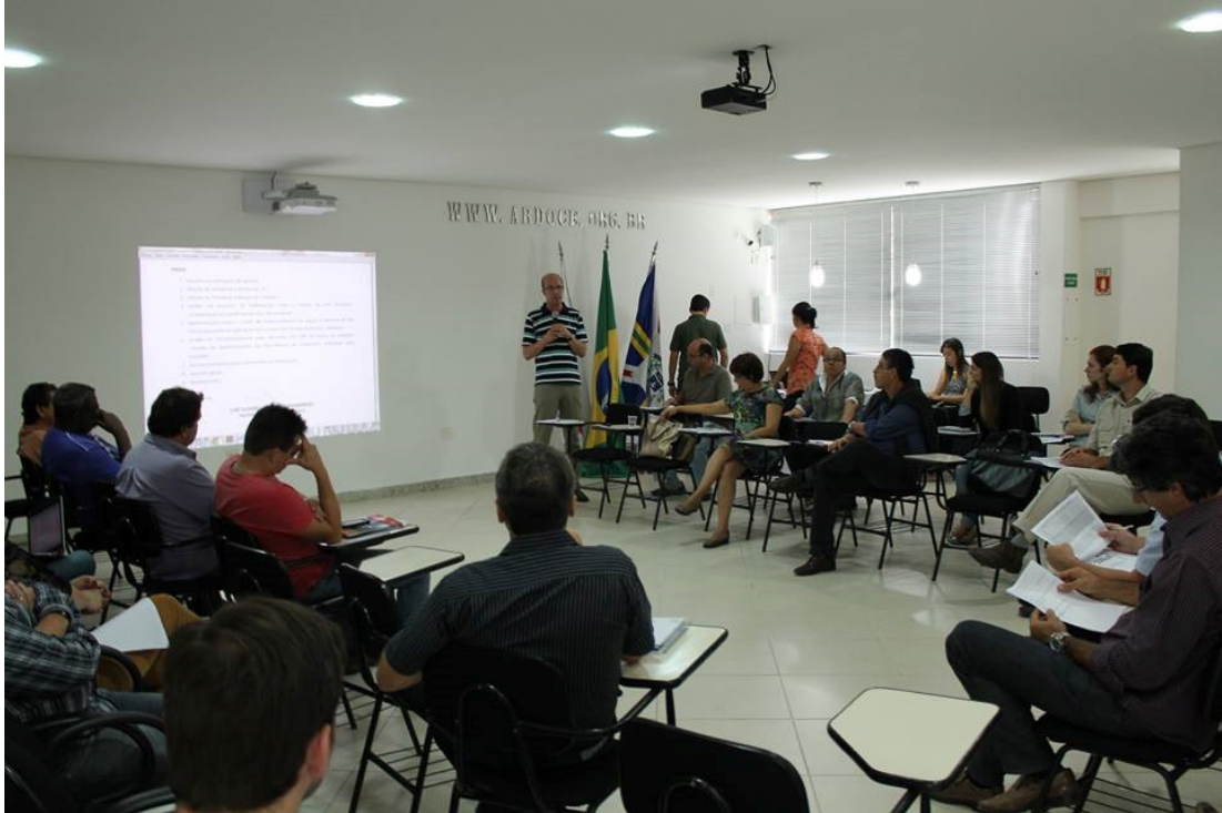
Reunião Diretoria Colegiada do CBH-Doce – 13/08/2014