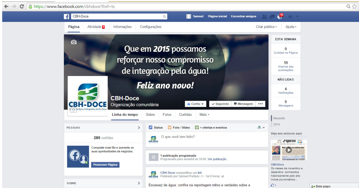
Fan page do CBH Doce

Gerência de Apoio aos Comitês de Bacia Hidrográfica - GECBH