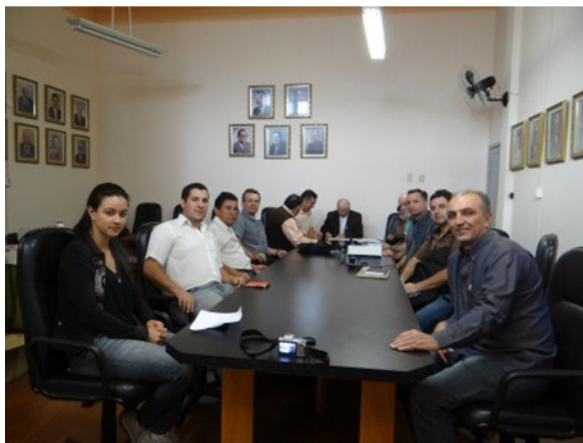
Reunião em Caratinga, no Centro Universitário de Caratinga