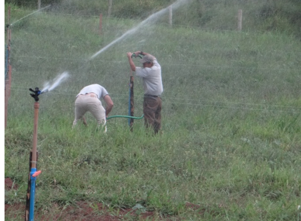
Avaliação do sistema de irrigação por gotejamento no município de Tarumirim - MG

Trabalhos de amostragem de solo e avaliação de equipamentos de irrigação