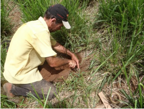
Retirada de amostras de solo, para avaliação físico – hídrica do solo, no município de Inhapim - MG

realizadas no município de Inhapim-MG e de avaliação de equipamentos de irrigação no município de Tarumirim-MG.